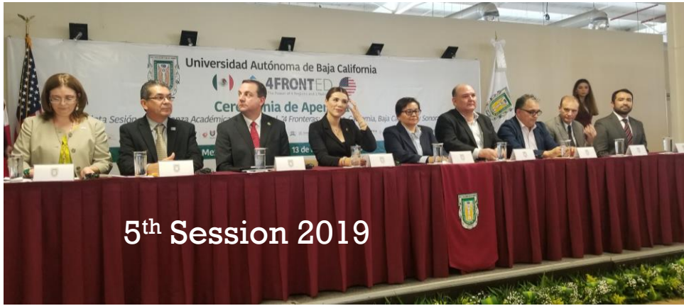
5th Session 2019