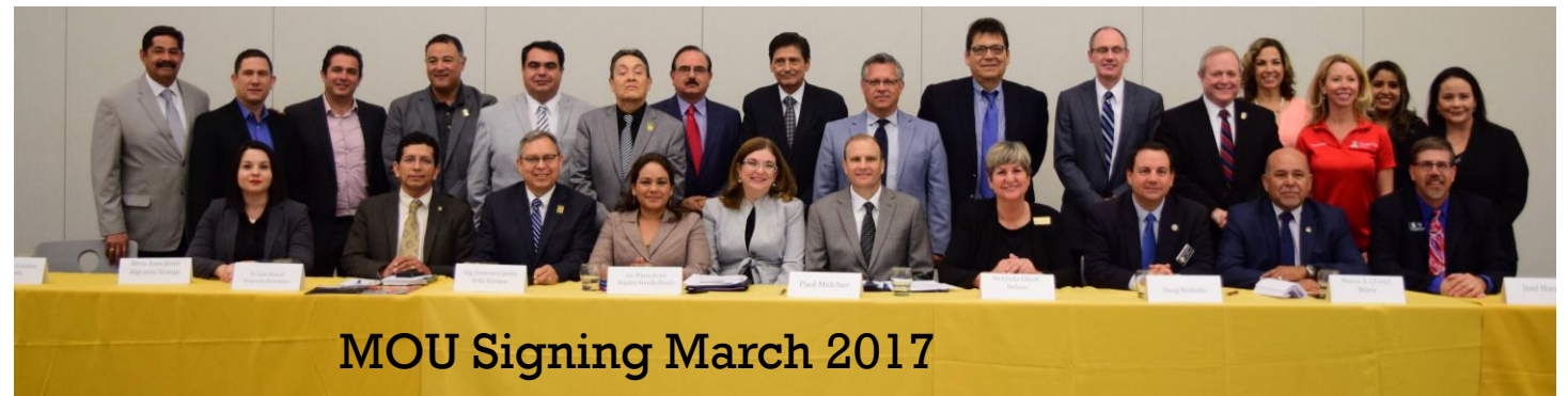
MOU Signing March 2017