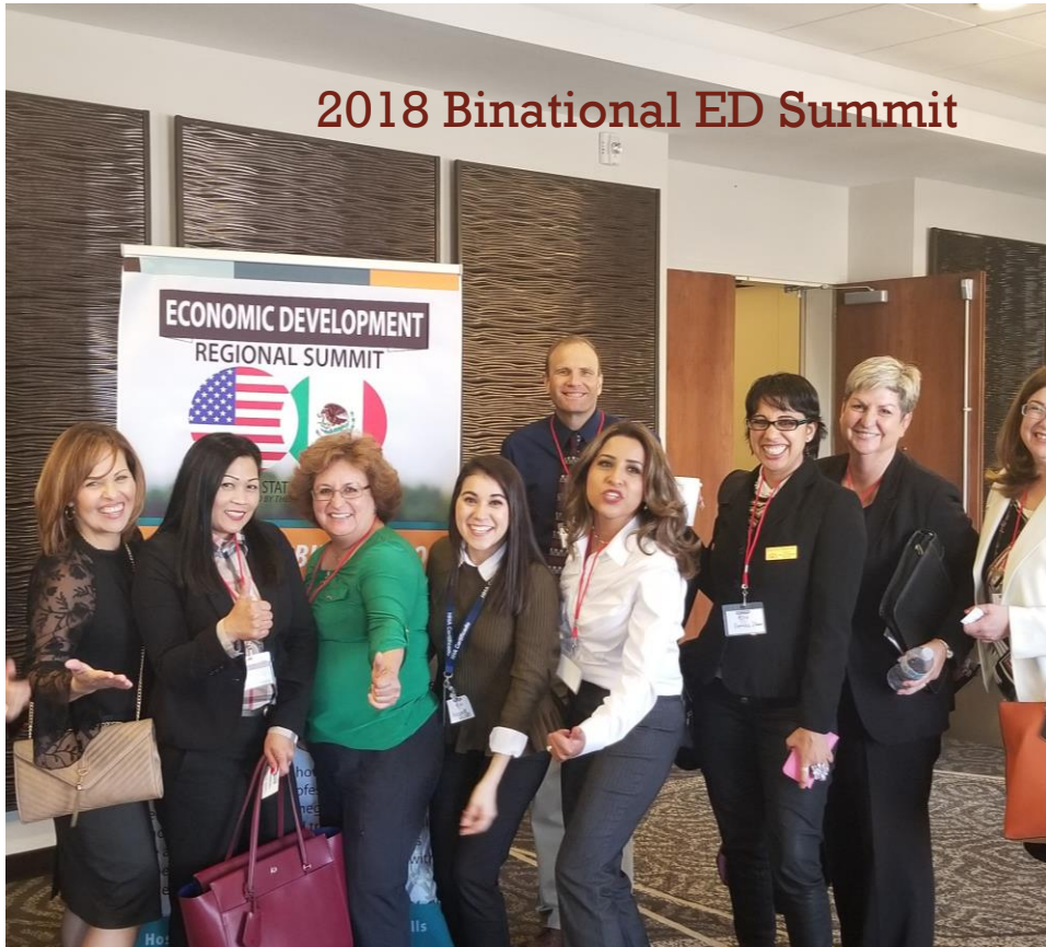
2018 Binational ED Summit