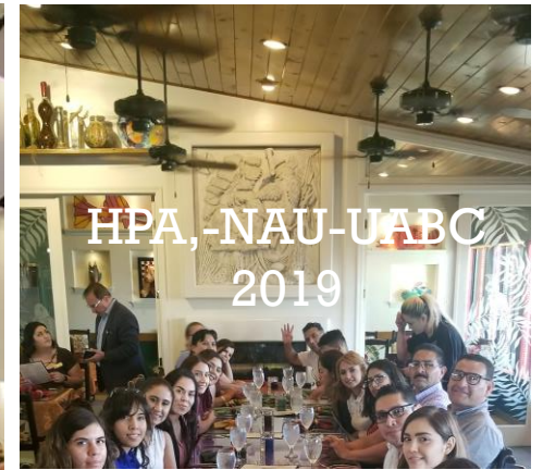
HPA, -NAU-UABC 2019