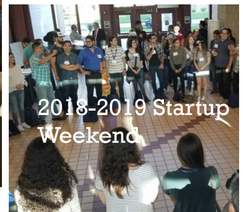
2018-2019 Startup Weekend