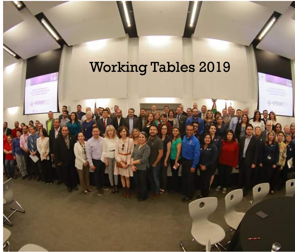
Working Tables 2019